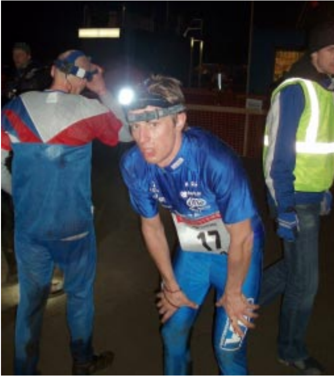
Coma - yön sankari.

massan mukana. 1,5min myöhemmin leimaan jälkijoukoissa. Skarppaa!